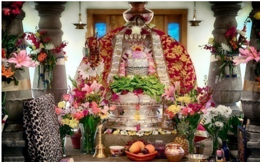
濕婆神 (Lord Shiva)

神在吠陀知識中的闡述，不是一位真實的形像的代表，而是修成的見性成道者所代表的各種能量特性的內涵，是一種能量可化為感覺或思想時對人們的影響，對人來說就是一些付諸行動的念頭的來源。所謂佛法常說的只要是人，就是靈性最高的動物，在佛法來說指的是必有佛心佛性，基督教說的是聖靈，其他伊斯蘭教推崇的阿拉，一般人理解的神，God，上帝。實質上都可稱為是大愛能量的來源，或靈性的能量。下述幾位記載於吠陀知識(Veda Knowledge) 中的重要之神。影響人靈性成長的能量來源。修行是恢復人原本清純神性(本性)的一條路。